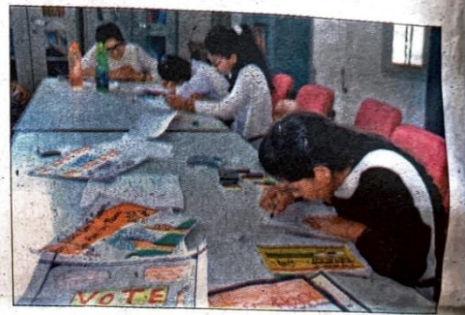
मतदाता जागरूकता के लिए पोस्टर बनाती छात्राएं।

चर्चा में छात्राओं ने बताया कि मतदान करना हर मतदाता का हक है और इससे ही एक मजबूत सरकार बनती है। देश में महिलाएं अहम स्थान रखती हैं। ऐसे में एक युवा और महिला हैं। के नाते सभी को अपने हकों के लिए मतदान करना चाहिए।