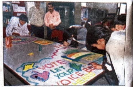
महिला कालेज में आयोजित प्रतियोगिता में रंगोली बनाती छात्राएं अमर उजाल